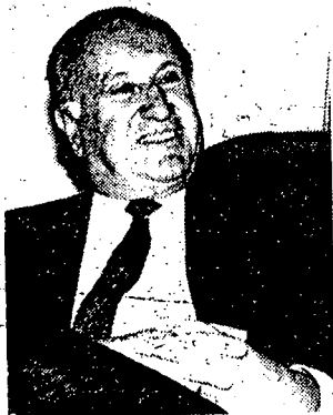
Doctor Misael Pastrana Borrero