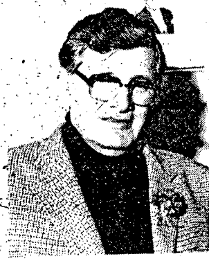
Doctor Julio César Turbay Ayala